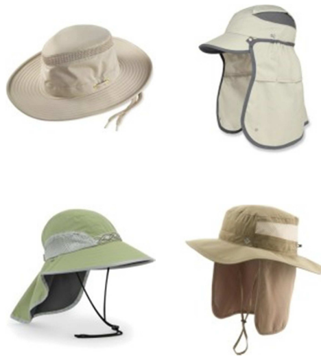
شکل ۵. نمونه ای از کلاه های مناسب مورد استفاده جهت محافظت در برابر پرتوهای فرابنفش