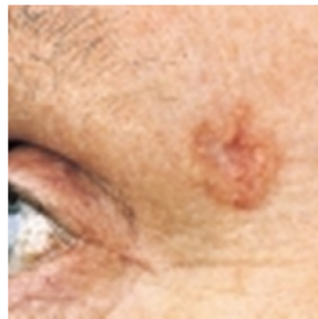
شکل ۱. شمایی از سرطان سلول های پایه (BCC)

شیوع NMSC به بیش از دو برابر افزایش یافت. در مطالعه ای دیگر خطر ابتلا به NMSC با توجه به قرار گرفتن شخص در معرض خورشید مورد بررسی قرار گرفت و نشان داده شد که در بخش هایی از بدن مانند گوش ها، صورت، گردن، ساعد و بازوها که معمولاً در معرض پرتوهای فرابنفش هستند NMSC شایع تر است. این به این معنی است که در طولانی مدت، تکرار مواجهه با پرتوهای فرابنفش، عامل اصلی ابتلا به NMSC می باشد. در برخی از کشورها رابطه ای مشخص بین افزایش بروز NMSC با کاهش عرض جغرافیایی (یعنی افزایش میزان پرتوهای فرابنفش) وجود دارد. سرطان سلول های بازال (BCC) (شکل ۱) شایع ترین نوع سرطان پوست به شمار می آید و نسبت به دیگر اشکال سلول های سرطانی پوست خطر کمتری دارد. سرطان سلول های بازال که در لایه اپیدرم (لایه خارجی پوست) قرار دارند سرعت رشد آرامی داشته و به ندرت گسترش می یابند. افرادی که پوست و موی روشن و چشم آبی، سبز و یا خاکستری دارند و همچنین اشخاصی که مشاغل آنها در فضای باز است و به طور متوالی در معرض پرتوهای فرابنفش هستند نیز از خطر بیشتری برای ابتلا به BCC پوست برخوردارند.